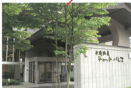
井頭温泉「チャットパレス」