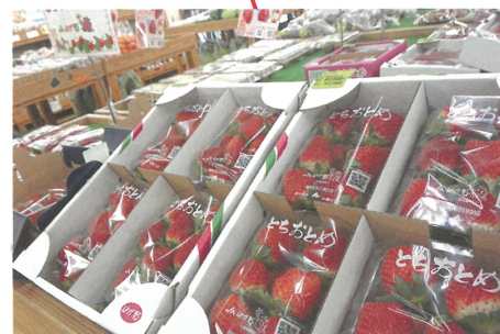
あぐりっ娘 地元の新鮮野菜・惣菜・生花