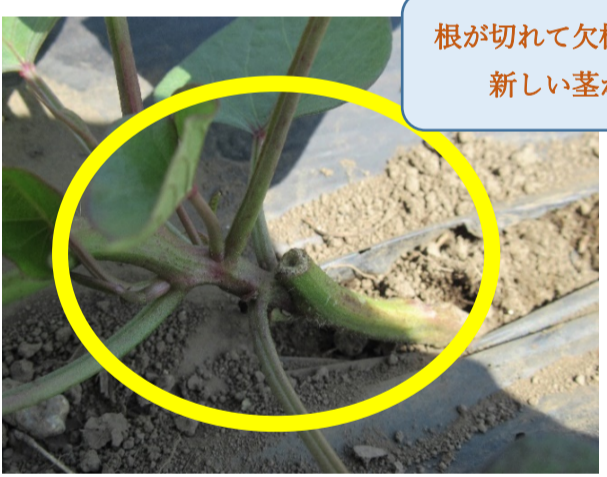
根が切れて欠株とおもっていたら、新しい茎がでてきました！