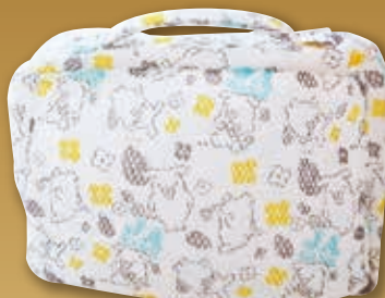
ウォッシュブルメッシュポーチ