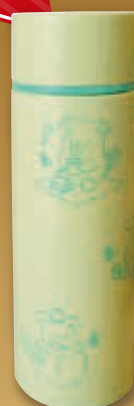
ミニステンレスボトル120ml