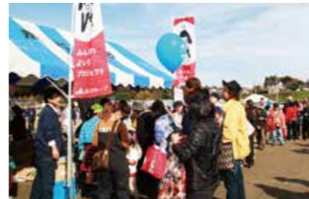
「JAまつりの組合員抽選会」