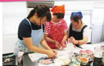
「女性大学のお料理教室」