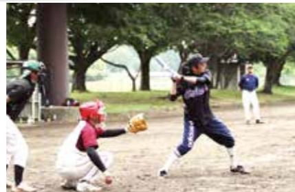
「青壮年部の野球大会」